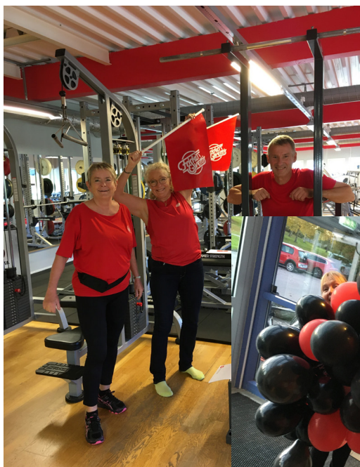
NYINVIGNING AV GYMMET