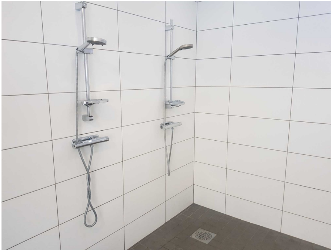
... och dito duschar.