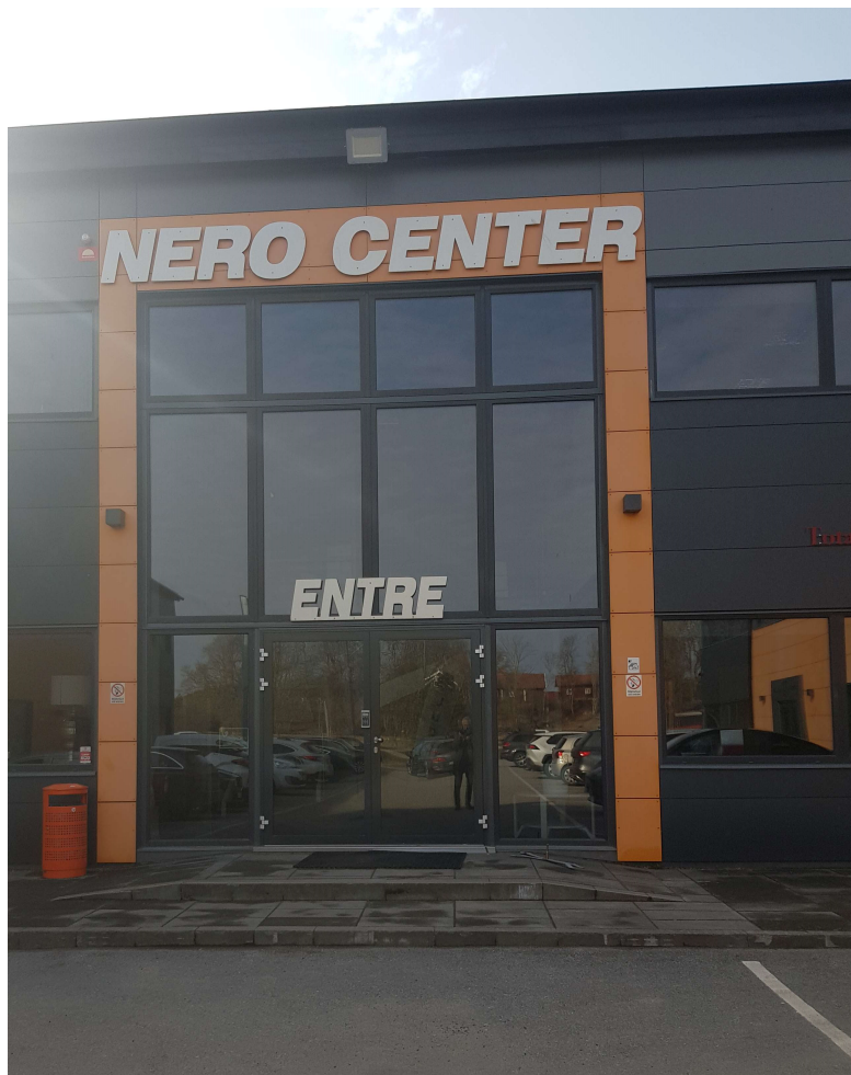
Entren till Nero