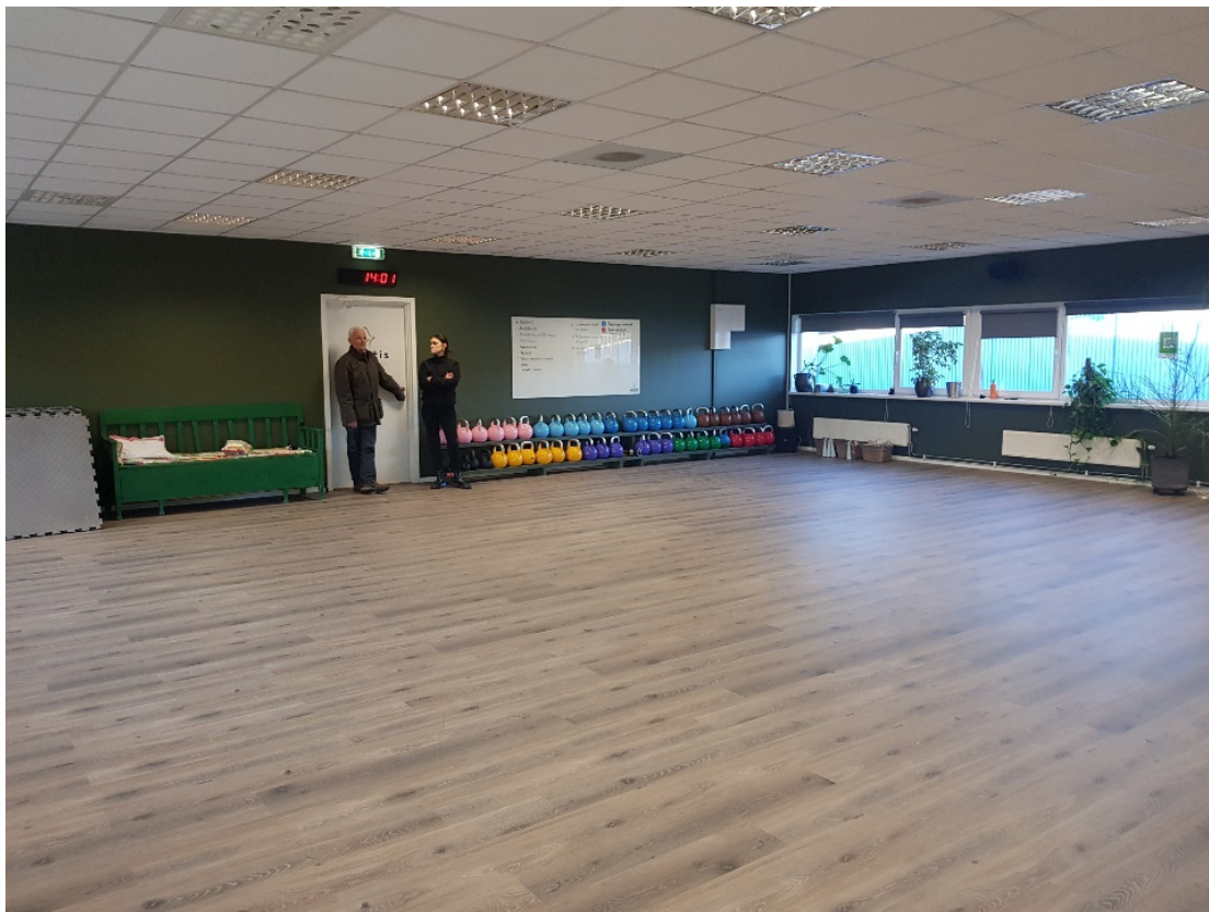
En stor sal för jympa, PowerHour, Skivstång mm.